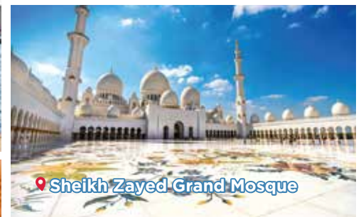
Sheikh Zayed Grand Mosque