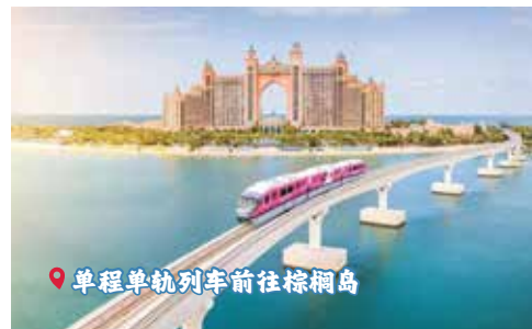
📍 单程单轨列车前往棕榈岛