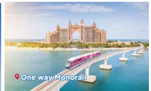
One way Monorail