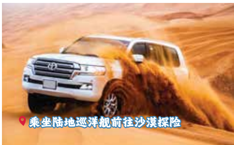
📍 乘坐陆地巡洋舰前往沙漠探险