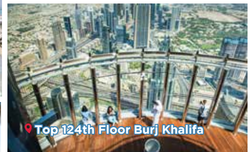
Top 124th Floor Burj Khalifa