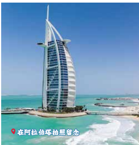
📍 在阿拉伯塔拍照留念

最后确认的行程将以旅行团抵达各地后接待社安排为准, 在不可预知之情况下, 敝社保留删改行程内容的权力, 恕不预先通知。*图片仅供参考。