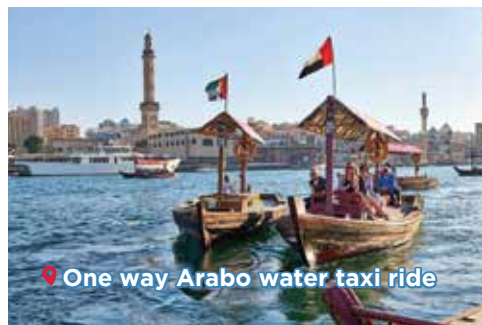
One way Arabo water taxi ride