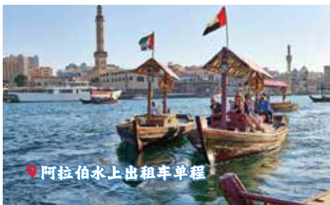
📍 阿拉伯水上出租车单程