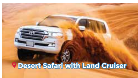
Desert Safari with Land Cruiser