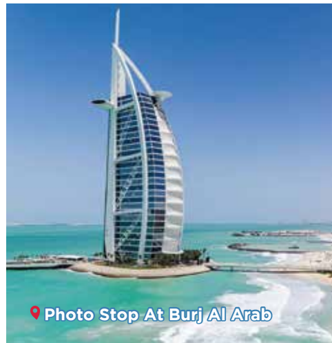
Photo Stop At Burj Al Arab

The order of itinerary is subject to the final discretion of local land operator, we reserve right to amend the itinerary due to the unforeseen circumstances without prior notice. * All pictures shown are for illustration purpose only.