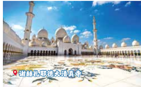
📍 谢赫扎耶德大清真寺